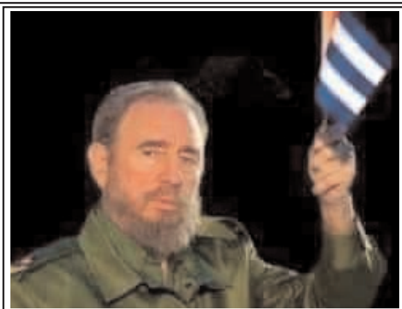
పాలకులు అవినీతి పరుడైతే..